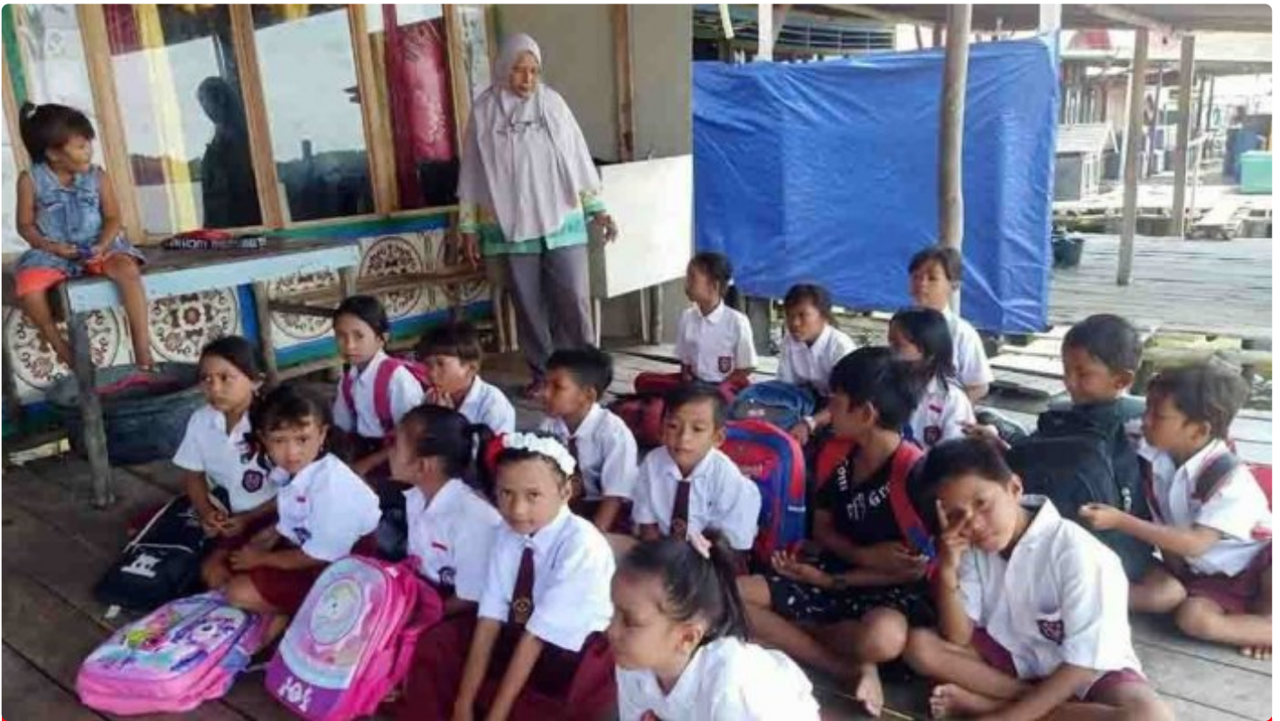
Pengabdian Seorang Guru di Desa Terpencil

LAMPUNG - Peringatan hari guru tahun ini semoga menjadi momentum yang tepat dan strategis untuk menatap masa depan pendidikan Indonesia yang lebih baik. Tantangan dan masalah yang sedemikian kompleks membutuhkan pemikiran yang mendalam. Guru sebagai garda terdepan harus terus menerus berbenah diri untuk mencerdaskan kehidupan bangsa. Pun negara harus hadir memperbaiki taraf hidup guru khususnya bagi guru honorer yang berada di Daerah 3T (Tertinggal, Terdepan dan Terluar).